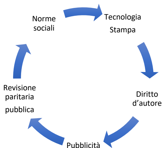
Figura 23-1: Il diritto d'autore accademico nell'era della stampa

Un principio che collega il diritto d'autore alle norme informali della scienza è rappresentato dalla distinzione tra idea non protetta e forma espressiva protetta [v. → Capitoli 6 e 11]. Infatti, come si è già detto, il diritto d'autore protegge solo la forma espressiva non le idee, le teorie, i fatti e i dati che sono alla base di essa. Le idee e le teorie scientifiche sono perciò in pubblico dominio. Tutti possono usare la teoria della relatività, ma occorre riconoscere la paternità di Einstein.